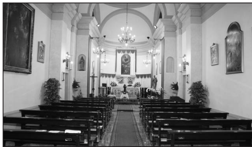
L'interno della chiesetta di S. Antonio recentemente sistemata.

Noi pensiamo che questi furti siano stati compiuti da bande